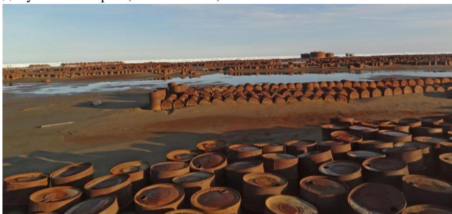
Загрязнения на острове Александры

В 2012 году начались полномасштабные работы по ликвидации данного ущерба на двух островах архипелага Земля Франца-Иосифа — острове Земля Александры и острове Гукера. Общая площадь территорий, где уровни загрязнения природной среды существенно превышают допустимые нормы, составляет 6,26 кв. км.